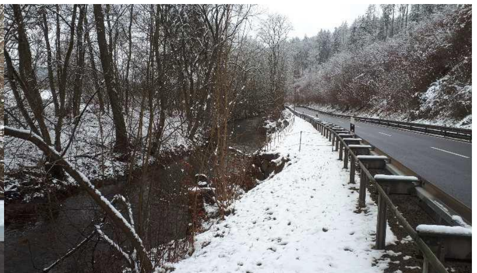
Abb. 2: Uferbereich mit der B 87 und massiver Ufersicherung