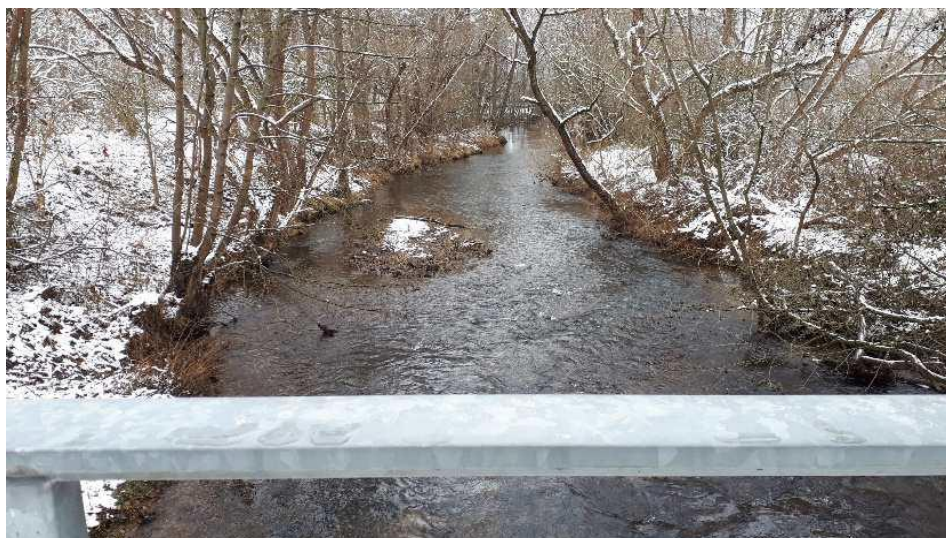
Abb. 1: Gewässerlauf unterhalb der Straßenbrücke

Das Projektgebiet befindet sich im Kreis Weimarer Land zwischen der Stadt Bad Berka und der Gemeinde München. Die Abschnitte 59 und 61 sind dem OWK Mittlere Ilm zugehörig. Der OWK Mittlere Ilm entspricht derzeit nicht dem geforderten ökologischen Zustand. Ohne zusätzliche Maßnahmen ist auch keine Verbesserung des ökologischen Zustandes zu erwarten. Für die Gewässerabschnitte 59 und 61 sind Maßnahmen zur Vitalisierung des Gewässers zu planen innerhalb des Gewässerprofils wie auch im Uferbereich. Diese können u.a. umgesetzt werden, indem man Ufer- u. Sohlbefestigungen entfernt, Stör- und Leitelemente zur Strömunglenkung in das Gewässer einbringt und naturnahe Uferstrandstreifen mit standortheimischen Gehölzen entwickelt. Damit soll ein Beitrag geleistet werden, um für den OWK Mittlere Ilm den guten ökologischen Zustand zu entwickeln (gemäß Europäischer Wasserrahmenrichtlinie - WRRL).