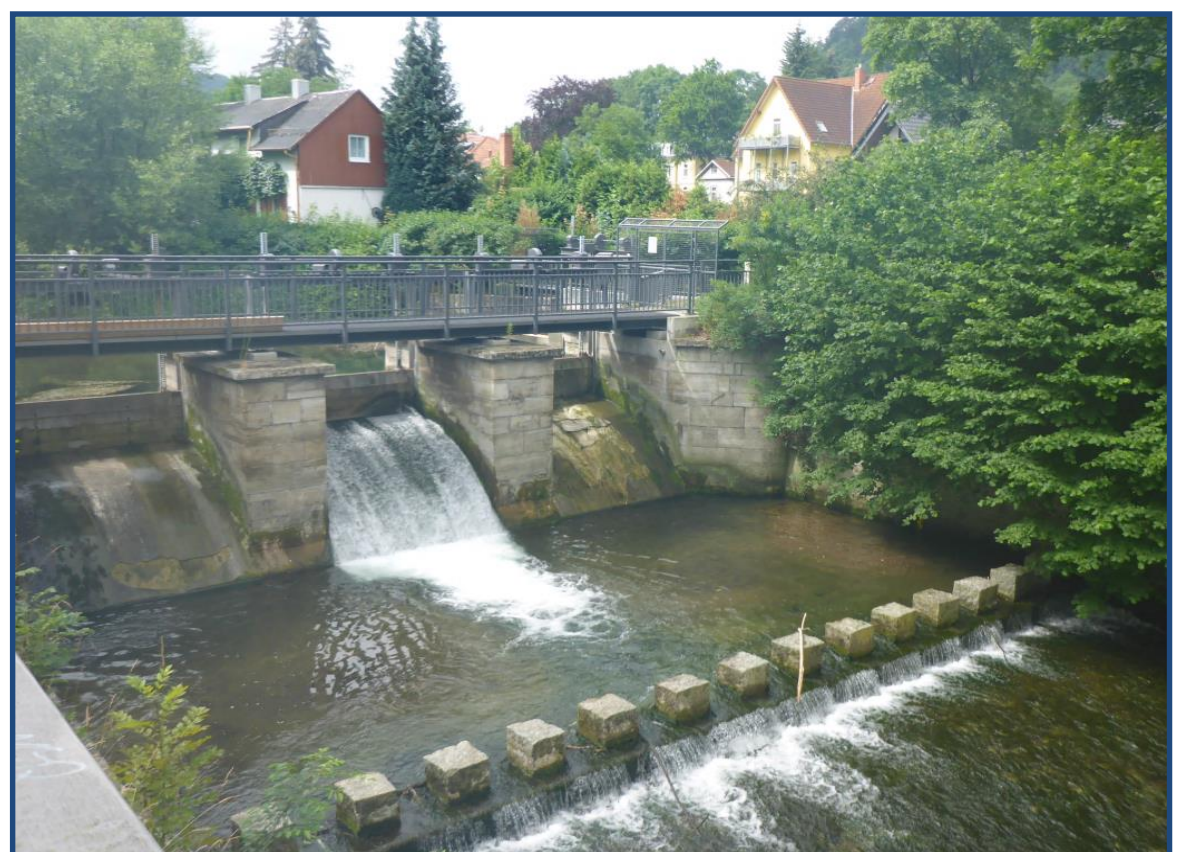
Wehr Arnstadt (Fürstenbergwehr) Bestand

Die Gera ist im Planungsgebiet ziemlich tief eingeschnitten. Die Wehrwangen sind aus Naturstein gemauert. Die Böschungen unterhalb des Wehres sind mit Wasserbausteinen befestigt. Im Oberwasser wird die Planungssituation noch durch die rechtseitig unmittelbar angrenzende Bahnlinie und die im Gewässer stehende Stützmauer erschwert. Die Maßnahme zur Umsetzung der EG-WRRL soll im 2. Bewirtschaftungszyklus umgesetzt werden.