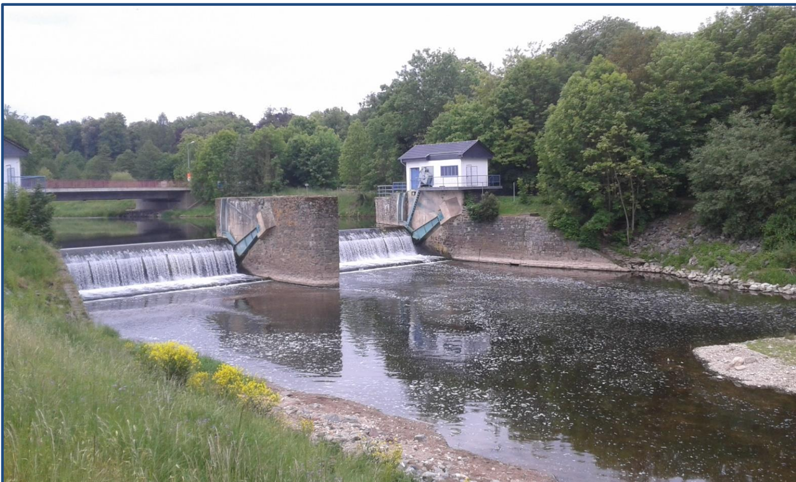
Wehr Bad Köstritz

Darüber hinaus sollen auch gewässerstrukturverbessernde Maßnahmen beitragen, den natürlichen Hochwasserrückhalt zu verbessern und gleichzeitig einen wirksamen Beitrag für das Erreichen des Zielzustandes zur Umsetzung der EG-Wasserrahmenrichtlinie leisten. Geplant ist des Weiteren die Herstellung der Durchgängigkeit am Wehr Bad Köstritz.