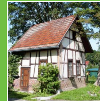
Leerstand in Gebäuden