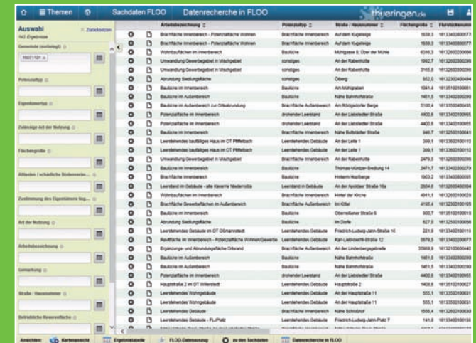
Recherche / Auswertung