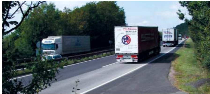
A 4 bei den Hörselbergen

■ Im Zuge der Umsetzung des Infrastrukturprojektes sichert der Bereich Grunderwerb der ThLG im Auftrag der DEGES die benötigten Trassen- sowie A- und E-Flächen durch Grunderwerbsverhandlungen mit den betroffenen Eigentümern bzw. Landnutzern. Dabei wird der Grunderwerb in den Flurbereinigungsverfahren über Landverzichtserklärungen abgewickelt. Insgesamt