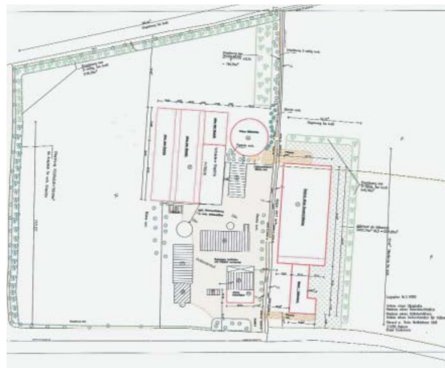
Lageplan zur Umnutzung der ehemaligen Domänenhofstelle zu einem modernen Milchproduktionsstandort

Im Rahmen der Eingriffsregelung hatte die Naturschutzverwaltung wiederum, wie auch bereits bei früheren Eingriffen in Natur und Landschaft entlang der Elbe, festgelegt, die Maßnahme im östlich von Cuxhaven gelegenen Hadelner/Belumer Außendeich zu kompensieren. Hierbei beabsichtigt die Naturschutzverwaltung langfristig die innerhalb des Sommerdeichpolders heute überwiegend im Eigentum privater Landwirte stehenden Grün-