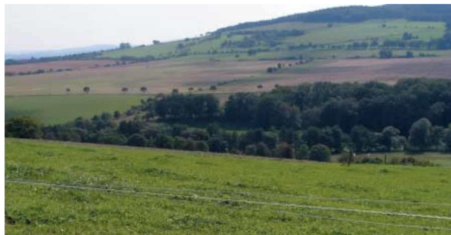
Umsetzung von Ausgleichs- und Ersatzmaßnahmen

wurden rd. 1.060 Grunderwerbsvorgänge bearbeitet, mit rd. 1.130 Eigentümern und 22 Landnutzern verhandelt und in einem Zeitraum von 6 Jahren rd. 440 Hektar für die DEGES gesichert. Der Grunderwerb konnte gerade in komplizierten Fällen in optimaler Weise mit den Möglichkeiten der Flurbereinigung und einem damit möglichen Flächenmanagement verbunden werden. Insgesamt ist der Grunderwerb erfolgreich verlaufen. Nur in 5 Fällen war eine Besitzeinweisung bzw. vorläufige Anordnung notwendig.