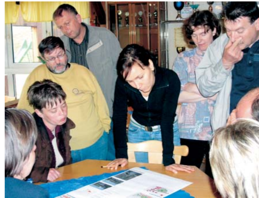
Erfolgreiche Moderation - mit Engagement und Sympathie

Der Wille der Region zu einer verstärkten Zusammenarbeit zeigt sich in dem bereits vorhandenen Zusammenschluss von Kommunen, Unternehmen und Einrichtungen zu einem Zweckverband Wirtschaftsförderung als Körperschaft des öffentlichen Rechtes. Dieser Zweckverband, der in der Region als bekannte Institution Vertrauen genießt, fungiert als Träger des RM. Die Durchführung obliegt der ThLG.