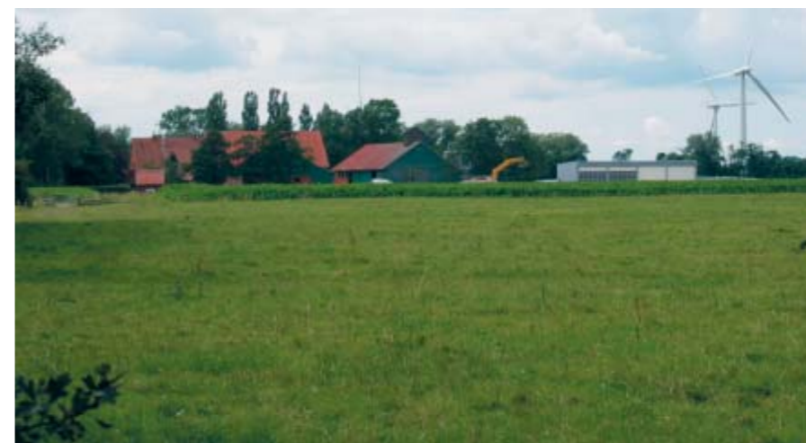
Die Arbeiten zur Umnutzung der ehemaligen Domänenhofstelle haben begonnen

landflächen in öffentliches Eigentum zu überführen, um damit eine Öffnung des Sommerdeiches und des Entwässerungssystems zu ermöglichen, so dass eine natürliche Entwicklung der Flächen unter dem Einfluss der Tideelbe erreicht wird.