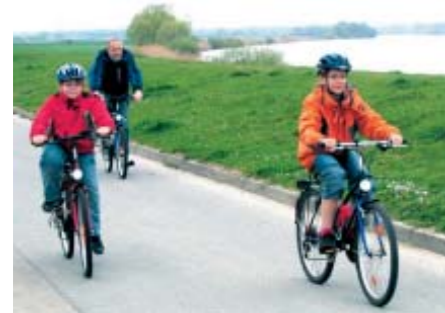
Radfahrer an der Elbe

Aus den Handlungsfeldern Landwirtschaft, Nachhaltige Wirtschaft, Naturschutz sowie Bildung, Kultur und Tourismus hat sich im Laufe des noch andauernden regionalen Entwicklungsprozesses neben einer Vielzahl von Ansätzen und Ergebnissen aus den vorgenannten Bereichen insbesondere der Bereich Bioenergie als Kernthema herauskristallisiert. Das Regionalmanagement der