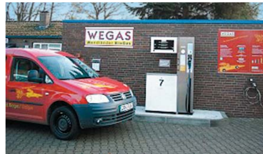
Die erste Biogastankstelle Deutschlands in Jameln, Wendland-Elbetal

■ Zeitgleich hat die NLG in Niedersachsen die Projektierung von rd. 80 Biogasanlagen teilweise mit Wärmenutzungskonzept betreut. Hierdurch konnte wichtiger Wissenstransfer erfolgen. Auch in den Bereichen „Veredlung zu Biomethan (Nutzung als Netzgas oder direkt als Treibstoff)“ und