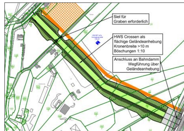
Abbildung 3, Hochwasserschutz Crossen