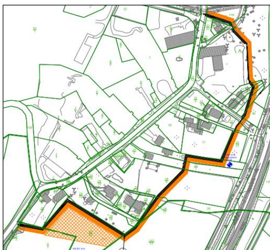
Abbildung 2, Hochwasserschutz Ahlendorf

Weiterhin bewirkt die Umverlegung der Weißen Elster auch ein zusätzliches Absenken der Wasserspiegel im Hochwasserfall. Mit dieser Maßnahme werden die Ziele des Hochwasserschutzes und der Europäischen Wasserrahmenrichtlinie in Kombination erreicht .