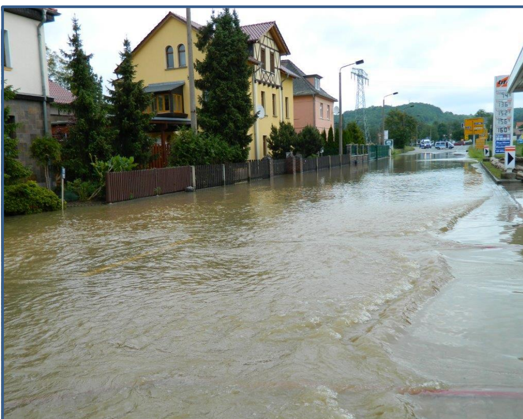
Bad Köstritz Juni 2013 Überflutung Bahnhofstraße und Tankstelle

Aufgrund der bekannten Hochwassergefährdung wurde in den Jahren 2012/2013 ein Hochwasserschutzkonzept für die Weiße Elster erstellt. Durch das Hochwasser im Mai/ Juni 2013 waren die Städte Bad Köstritz und Gera erheblich überschwemmt und geschädigt.