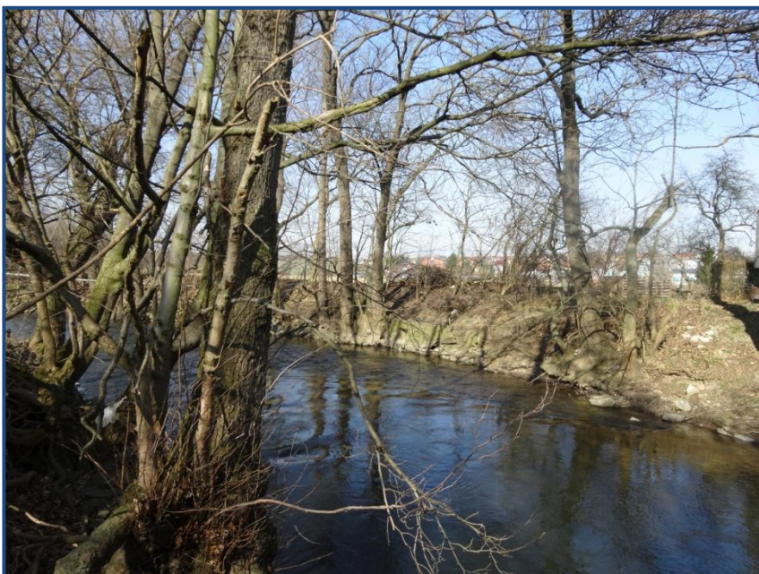
Abb. 1: steile Uferböschungen, überwiegend einreihige Gehölze mit geringer Altersstruktur

Der zu betrachtende Gewässerabschnitt befindet sich im FFH-Gebiet „Iltal zwischen Bad Berka u. Weimar mit Buchfarter Wald“ (DE 5034302). Er beginnt im Unterwasser der Wehranlage Ölmühle bei Mellinger und endet am Ortsrandbereich von Taubach. Die Ilm ist in diesem Abschnitt stark verändert und verläuft weitestgehend geradlinig. Das Gewässerprofil ist durchgehend trapezförmig und abschnittsweise tief eingeschnitten. Gemäß Gewässerrahmenplan sind in den Abschnitten 42 und 43 Maßnahmen zur Initiierung der Eigendynamik sowie im Abschnitt 45 Maßnahmen im Gewässerprofil zur Habitatverbesserung zu planen. Diese können u.a. umgesetzt werden, indem man Ufer- u. Sohlbefestigungen entfernt, Stör- und Leitelemente zur Strömungslenkung in das Gewässer einbringt und naturnahe Uferstrandstreifen mit standortheimischen Gehölzen entwickelt. Des Weiteren befindet sich im Abschnitt 42 ein Altarm. Im Rahmen des Projektes wird untersucht, inwieweit ein Anschluss des Altarms an die Ilm möglich ist.