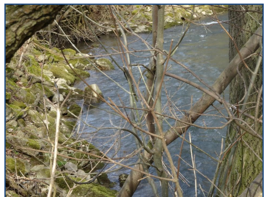
Abb.2: Steinschüttung zur Böschungssicherung