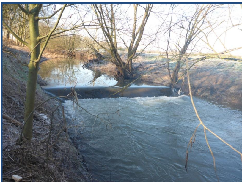
Sohlenabsturz HM 16 (Blick aus dem Unterwasser)

Zur Zielerreichung sollen neben dem bevorzugten vollständigen Rückbau der Sohlenstufe ggf. auch andere alternative Varianten untersucht werden. Dabei sind die durch die geplanten Maßnahmen hervorgerufenen Auswirkungen z.B. auf Wasserstände und Fließgeschwindigkeiten zu betrachten. Mit der Planung soll gewährleistet und nachgewiesen werden, dass mit dem Vorhaben keine Verschärfung der Hochwassersituation oder eine unerwünschte Sohl- und Ufererosion erfolgt.