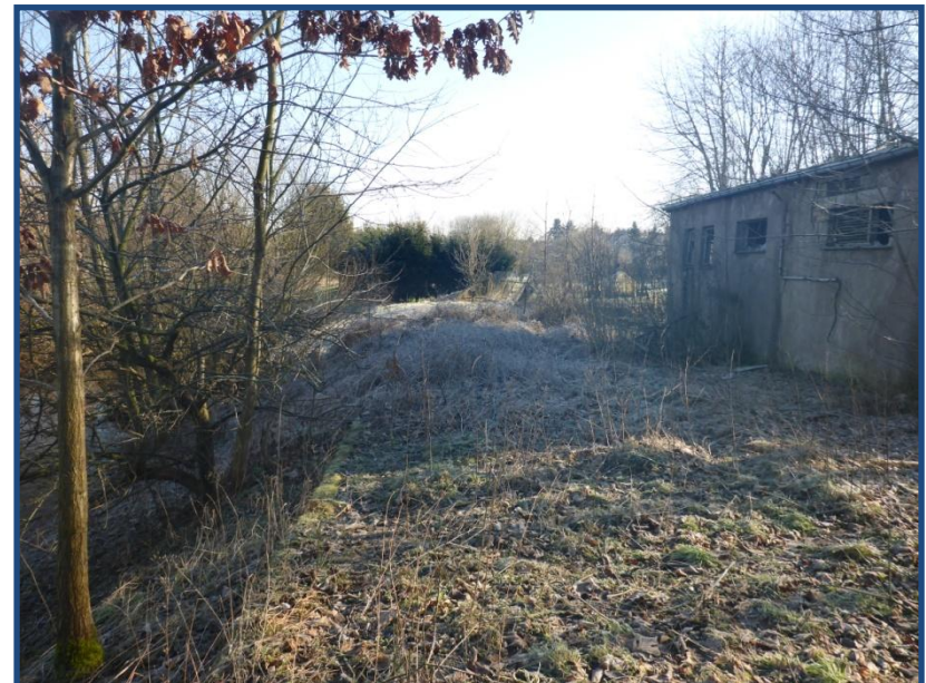
ehem. Pumpwerk im rechten Vorland

Das Hauptziel der Maßnahme ist die Herstellung der linearen Durchgängigkeit am Sohlenabsturz HM 16 bei Hesserode im Landkreis Nordhausen. Dies umfasst unter Berücksichtigung des Gewässertyps, der gewässertypischen Fischarten und bodenorientierten Organismen sowie der standortbezogenen Randbedingungen die Herstellung der Passierbarkeit des Querbauwerkes stromab- und stromaufwärts.